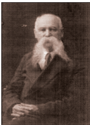
Мал. 8. Микола Левитський (1870–1935)

а й економічної кмітливості. Мало було щось виростити чи вигодувати. Необхідно було ще й вигідно продати, аби потім закупити сільськогосподарський реманент і багато чого вкрай необхідного для життя в селі. Часто такі послуги пропонував місцевий поміщик чи заможний селянин, чи перекупник. Але майже в усіх випадках це були грабіжницькі операції, які підтримували і без того слабе селянське господарство.