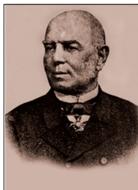
Мал. 4. Іван Харитоненко (1820–1891)

Протягом 1860–1880-х рр. ним було побудовано шість цукроварних і рафінадних заводів — найпотужніших в Україні та Росії, кожний з яких щорічно виробляв до 900 тис. пудів цукру. До заводських комплексів входили цегельні підприємства, ремонтні майстерні, парові млини. Харитоненки вкладали гроші не лише в землю та цукропромисловість, а й брали участь у багатьох акціонерних товариствах, зокрема в Сумському машинобудівному, були співзасновниками товариства Білгород-Сумської залізниці.