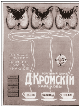
Мал. 6. Реклама шоколаду, какао