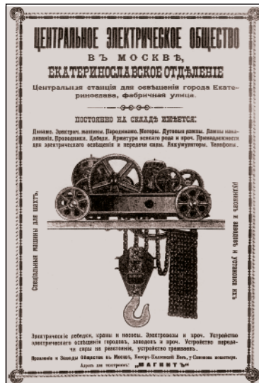
Мал. 7. Реклама електрообладнання