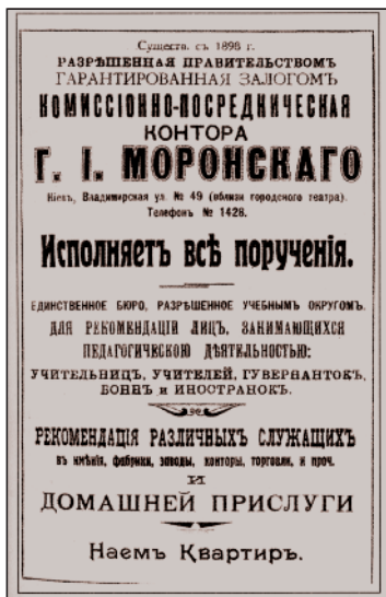
Мал. 5. Реклама найму прислуги та здачі квартир